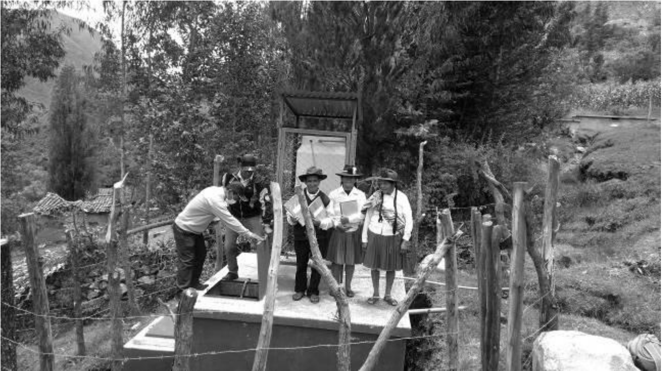
Calificación en concurso de JASS