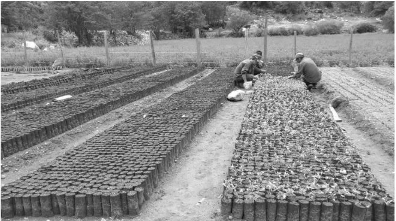
Repique de almacigos de cedro en el vivero de Misanapata