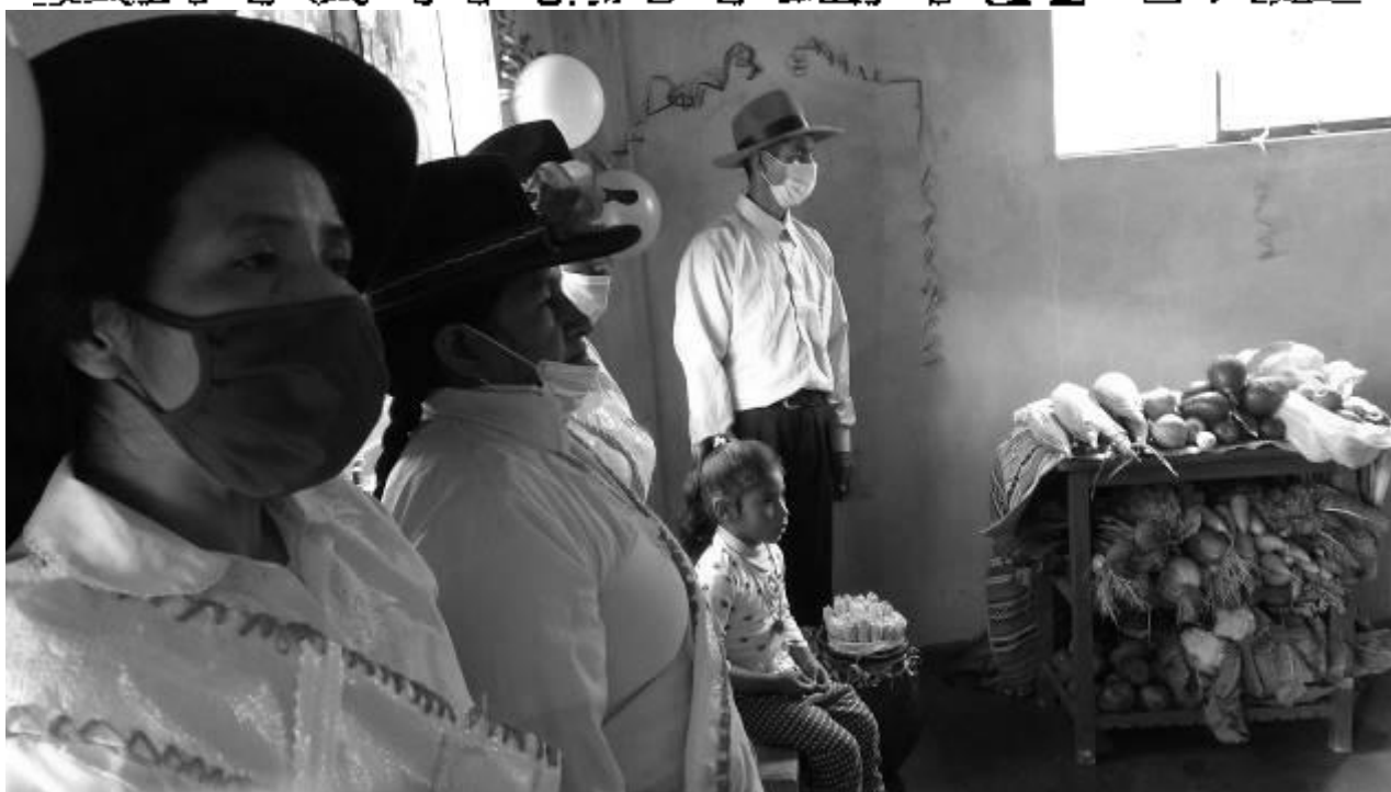
Grupo de ahorradoras en Accha