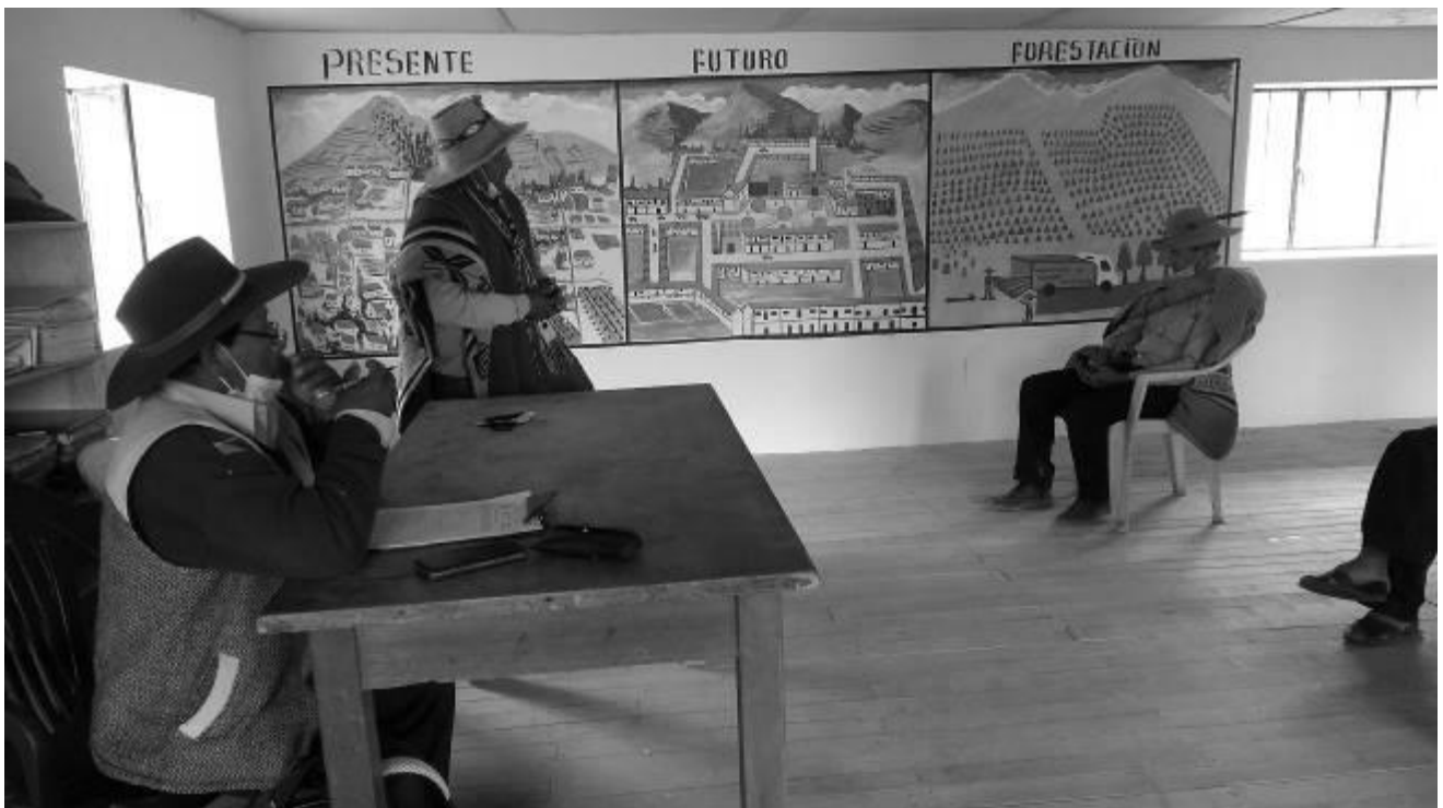
Evaluación del concurso comunal

La Junta de Jurados puede invitar a las autoridades de su Distrito, funcionarios públicos y otras autoridades y personas que puedan realzar el evento de premiación y clausura.