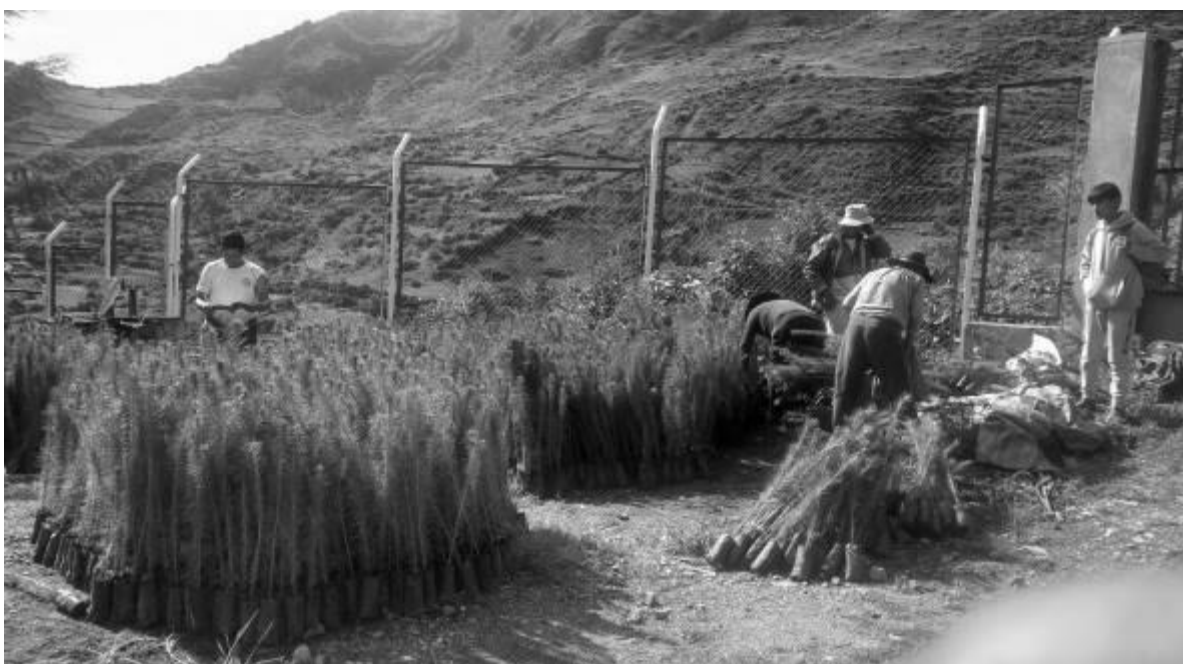
Faena para plantación forestal de pino